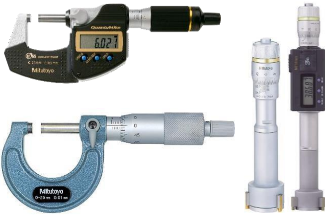
Micrômetro Externo / Interno (Digital e Analógico)