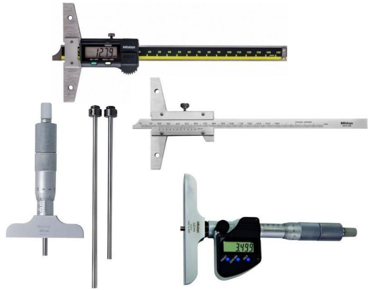
Medidor de Profundidade Micrômetro / Paquímetro (Digital e Analógico)