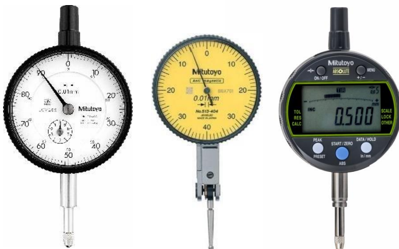
Relógio Comparador / Apalpador (Digital e Analógico)