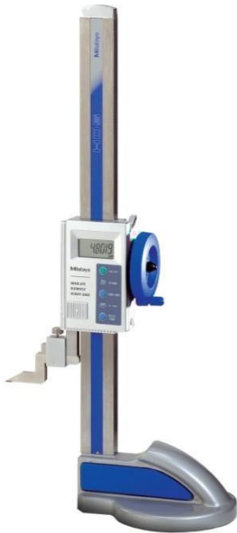
Traçador de Altura (Digital e Analógico)