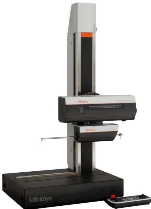
Perfil e Rugosidade Formtracer