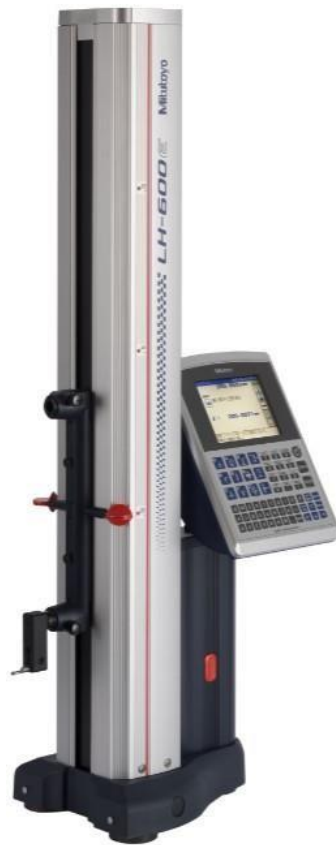
Linear Height – Calibrador de Altura 2D de Alta Performance