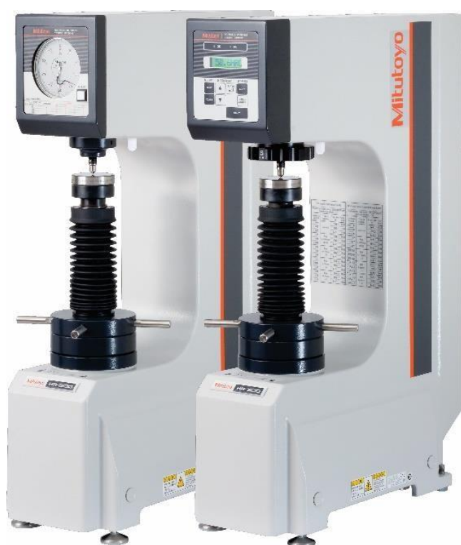
Durômetros Rockwell (Digital e Analógico)