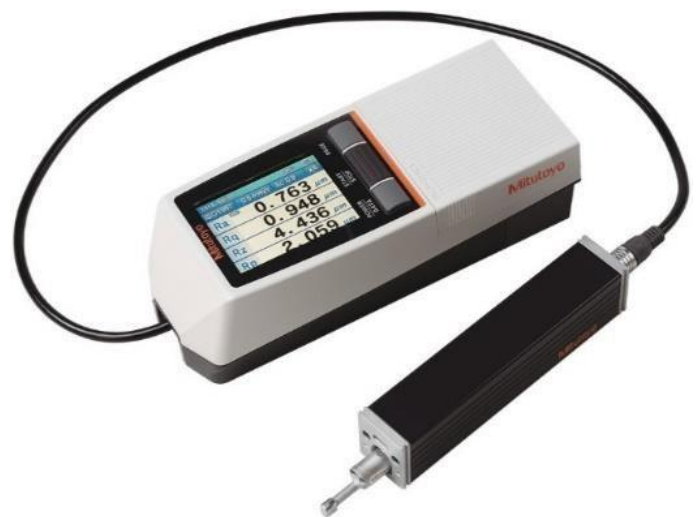
Rugosímetro - Surftest