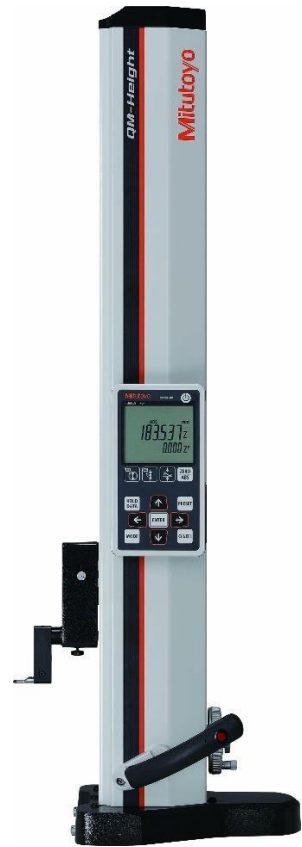
QM Height – Calibrador de Altura ABSOLUTE de Alta Precisão