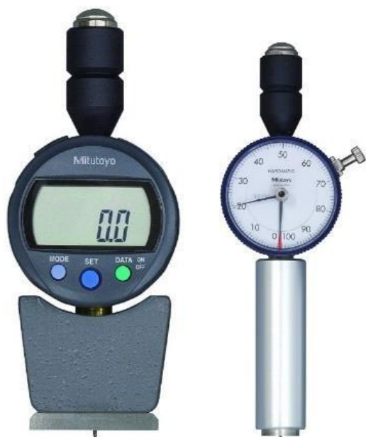
Durômetros Shore (Digital e Analógico)