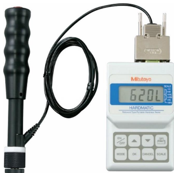
Durômetro Portátil por Impacto (HARDMATIC HH-411)