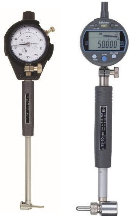
Comparador de Diâmetro Interno (Digital e Analógico)