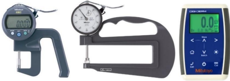
Medidor de Espessura (Digital, Analógico e Digiderm)