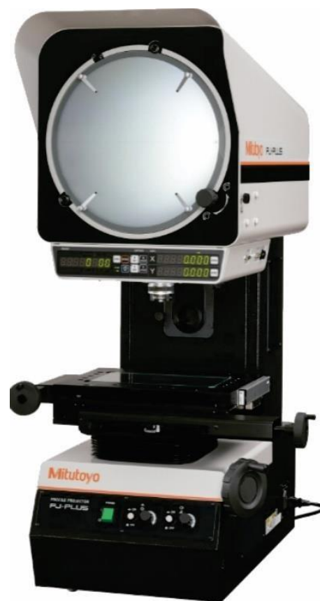
Projektor de Perfil